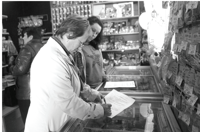
Предписано благоустроить. В ряде торговых точек комиссия выписала предписания.

В прошлую пятницу административная комиссия городского поселения провела проверку торговых точек п.Думиничи на предмет их благоустройства. Каждый магазин заслужил свою оценку, но можно подвести и общий итог: в целом неплохо, но есть над чем работать, есть простор для фантазии, для заботы о покупателях и о всех окружающих.