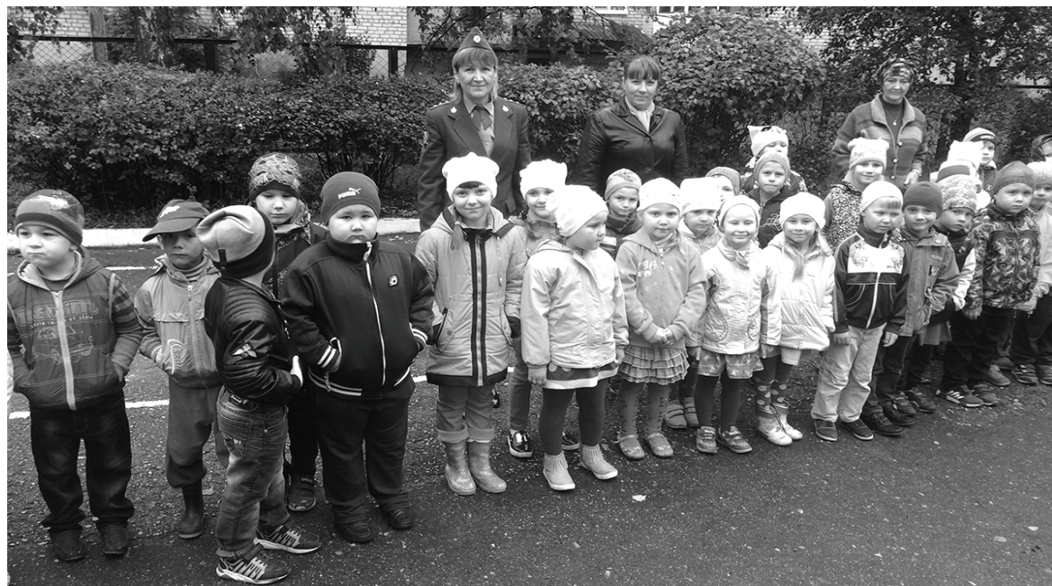
Материалы подготовила Светлана Шальгина, инспектор по пропаганде ОГИБДД МОМВД России «Сухиничский».

вилами поведения пешехода и водителя в условиях улицы. С удовольствием дети отгадывали загадки по ПДД, вспоминали литературных героев и средства их передвижения.