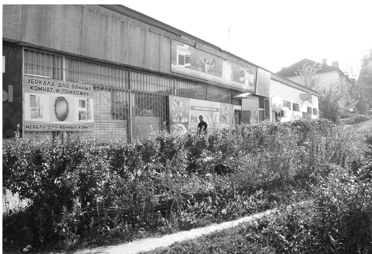
Территория у магазинов на Б.Пролетарской. Было и стало.